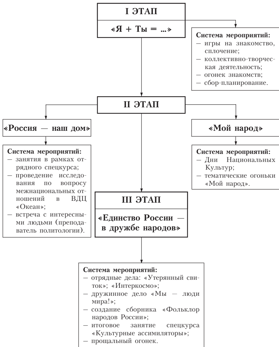
Схема № 1. Этапы программы «Единство России — в дружбе народов»

Как показано на приведенной ниже схеме, программа осуществляется в три этапа.